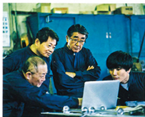
中小企業・商店街支援に check! 予算3,639億円