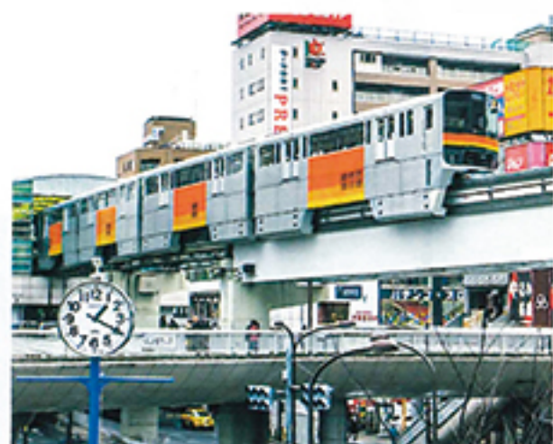
多摩・島しょの振興に check! 予算2,393億円