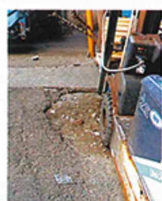
築地市場内のアスファルトの亀裂

首都直下地震に耐えることはできません。耐震化されていない築地市場には、事業者・買参人・観光客などを始め、毎日4万人超の来場者があることを考えると、知事は市場開設者として、安全の確保と東京の食の供給に責任があります。 加えて、築地市場にはアスベストや土壌汚染問題、さらには、土壌の汚染物質を遮断すべきアスファルトに多くの亀裂が見られるなど、食の安全安心が危惧されます。応急処置的な整備の繰り返しでは、いずれ破綻するのは明らかです。