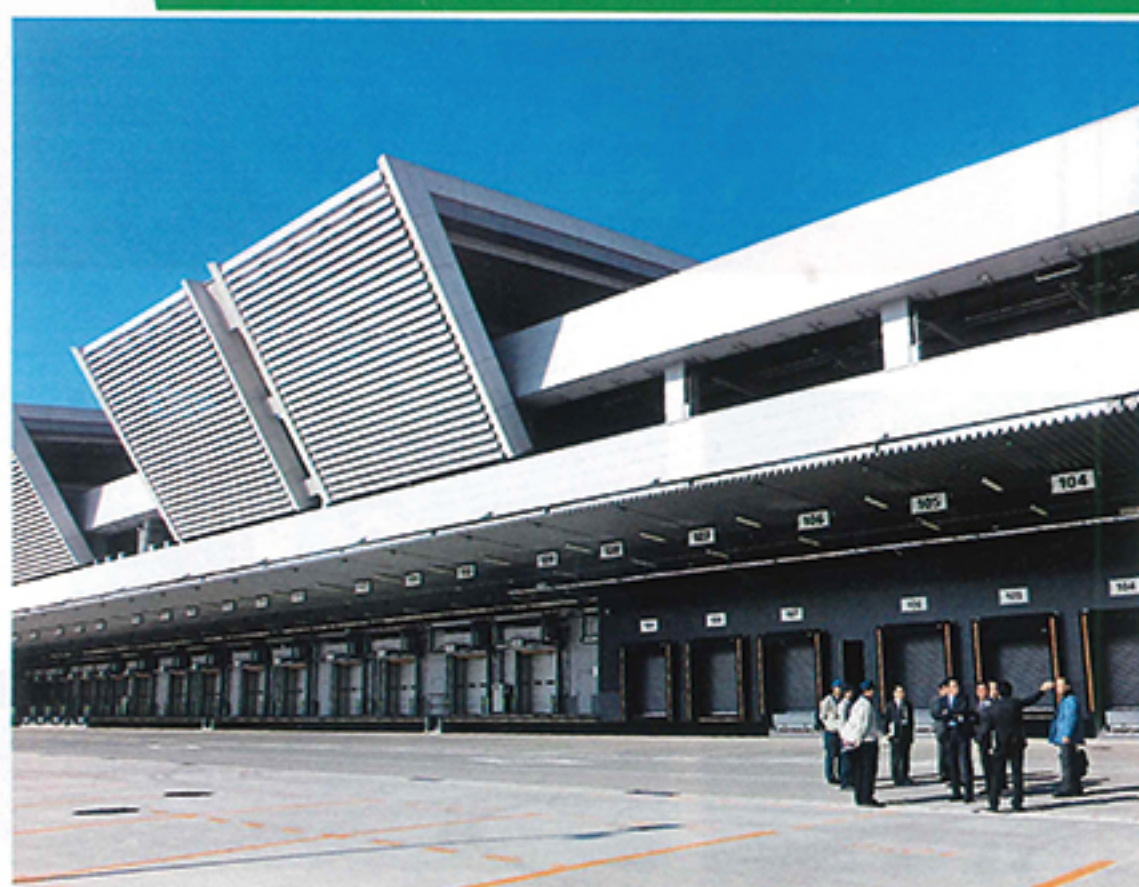
豊洲市場を視察する都議会自民党議員団