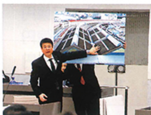
都議会予算特別委員会でも築地市場の窮状を訴えました

都民に「安全安心な食料品を安定して供給」して行くには 近代的かつ持続可能な豊洲市場への移転しかありません！